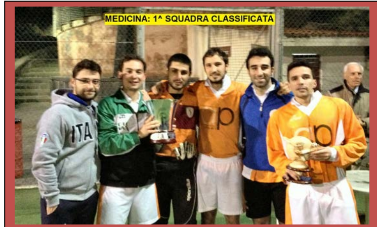
MEDICINA: 1ª SQUADRA CLASSIFICATA

Al torneo hanno preso parte nove squadre: Amministrazione, Agraria, Polo Umanistico, Policlinico, Medicina, KYR 29, Scienze, L.N.S. e, per la prima volta, la O.V.E. (Ospedale Vittorio Emanuele).