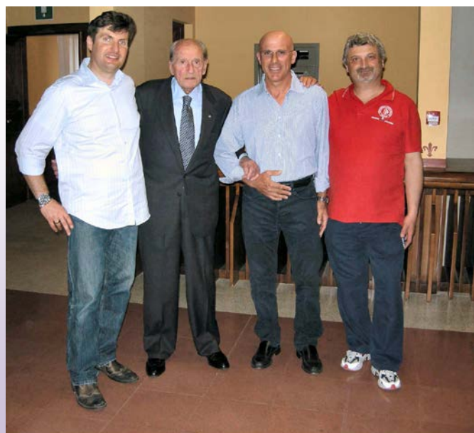
Firenze XXVIII Campionato Nazionale Universitario di Ciclismo 4 - 5 Maggio 2013

Calato il sipario sulla 28ª edizione dei Campionati, il nostro Gatti, novello Alan Ladd in “Shane il cavaliere della Valle Solitaria”, ha ripreso la sua cavalcatura e si è allontanato nella luce di un disco solare morente dietro le placide colline toscane. Chissà, si chiedeva, se un giorno potrò interpretare “I magnifici sette”?!